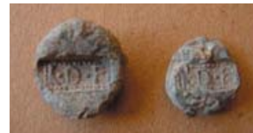
Twee loden verzegelingen die mogelijk een Romeins schrijftafeltje afsloten. De zegel is gemerkt met de letters LDF.