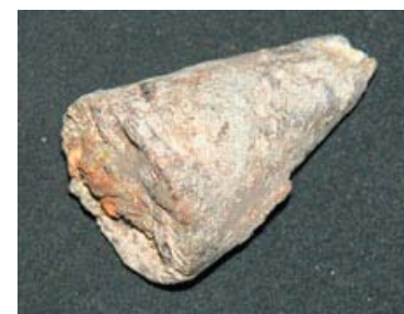
Dit loden kegeltje met een restant van een ijzeren oog is een schietlood. Dit was mogelijk een onderdeel van een groma. De groma werd gebruikt door landmeters in de Romeinse Tijd om rechte lijnen en rechte hoeken uit te zetten. De groma droeg vier kleine schietloden.