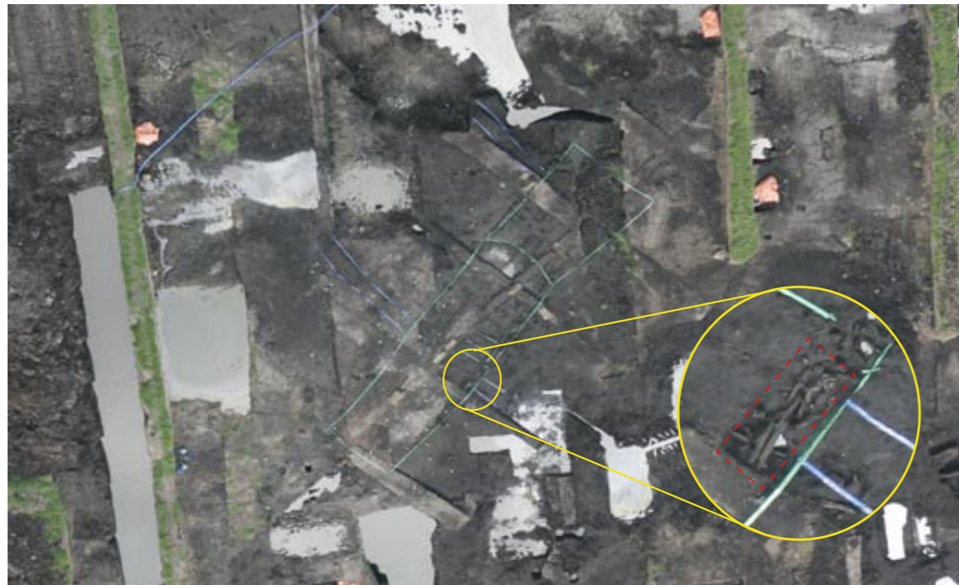
Luchtfoto van gebouw 1 in vondstzone 9, de boerderij waar de oudste drempel gevonden is. De groene lijnen laten de wanden van het huis zien. De blauwe lijnen geven de omtrek van de takkenpaden weer. De gele cirkel zoomt in op de drempel.