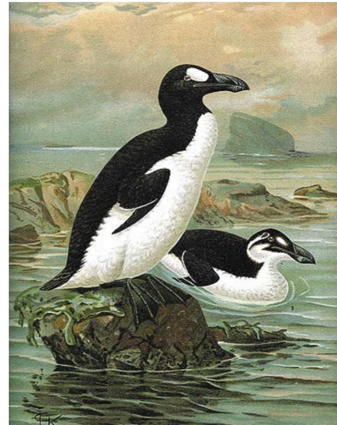
Boven: reuzenalken, getekend door J.G. Keulemans