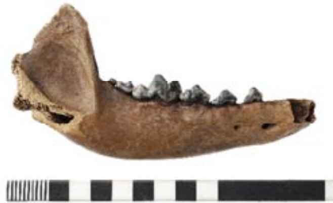
Boven: onderkaak van een hond