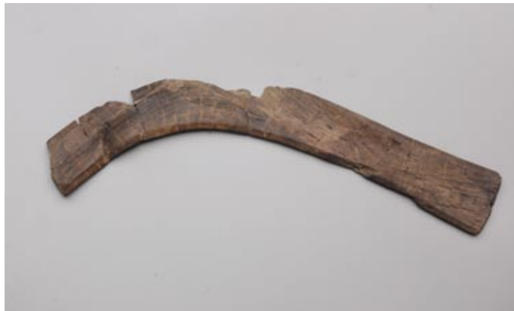
Links: de boemerang van Hoogstad. Deze boemerang was met name zeer geschikt voor de jacht op vogels.