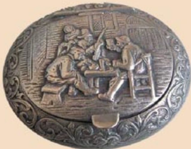
Dit is een snuifdoosje waar de snuiftabak in werd bewaard. Het doosje komt uit de eerste helft van de 20e eeuw. Op het deksel is een kroegscène te zien.