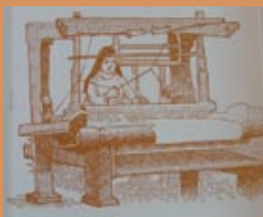
Illustraties door Martin Valkhoff.