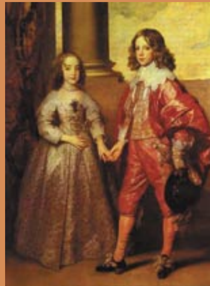
Schilderij van Anthonie van Dyck 1641: Het huwelijk van prinses Maria Stuart (10 jaar) en prins Willem van Oranje (15 jaar), zoon van Frederik Hendrik.

Op het schilderij de Kinderspelen van Pieter Brueghel uit 1560 is te zien wat de kinderen van het gewone volk droegen. De meeste kinderen droegen een leren buideltje aan de riem, waar ze hun knikkers, koten en bikkels in kwijt konden. De meisjes droegen rokken en de jongens vaak een tuniek met daaronder een soort van legging.