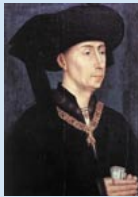
De vroege vorm van de kaproen (links) wordt over de nek en de schouders gedragen. Later wordt de punt van de kaproen door de adel als een tulband om het hoofd gedrapeerd. Rechts is een schilderij van Philips de Goede uit 1450.