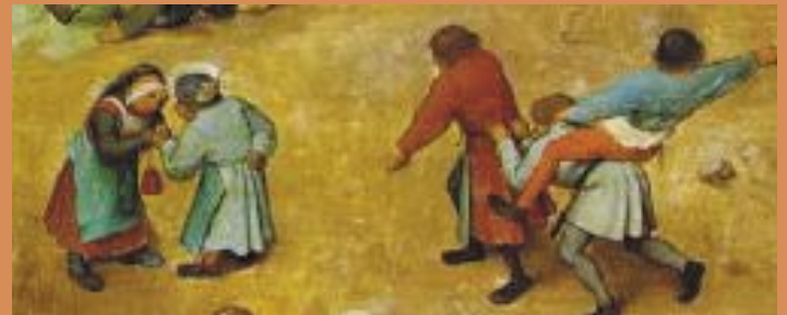
Detail van de Kinderspelen van Pieter Brueghel uit 1560.