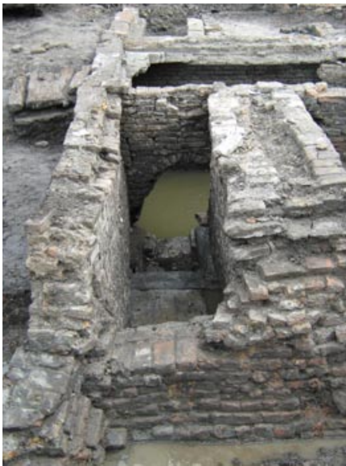
Foto van de beerkelder van het provenienshuis met boogconstructie. In de beerkelder gooide de bewoners vroeger hun afval en uitwerpselen.

Het is lente en ook op Gouda Bolwerk schijnt de zon. Dan zitten zo'n veiligheidsoverall en dikke rubber handschoenen niet altijd even lekker. Desondanks graven de archeologen hard door. Naast de grote kraanmachine is er sinds donderdag 17 april een klein kraantje in het veld bij om het team te assisteren. Het kraantje is een uitstekende hulp bij het graven tussen muren en in ommuurde ruimtes. Het middengedeelte van de put is inmiddels verdiept naar een derde opgravingsvlak. In het middengedeelte zijn verschillende fasen van huizenbouw zichtbaar, waarvan de oudste nu in de 15e eeuw gedateerd wordt. De huizen zijn gefundeerd op houten palen. Langs het middendeel laten de archeologen een strook grond staan; dit is