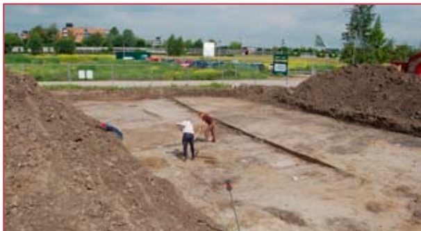
Archeologen van de Archeologische Werkgemeenschap Nederland (AWN) graven op in de Blokhoeve.

Een probleem bij het interpreteren van paalgaten zijn grondverstoringen uit latere periodes. Bijvoorbeeld een middeleeuwse greppel die over een Romeinse huisplattegrond loopt. Daarnaast kan het zijn dat maar een deel van de huisplattegrond in de opgravingsput ligt. De andere helft wordt dan niet opgegraven. Het komt daarom vaak voor dat archeologen maar een deel van een gebouw vinden en naar de oorspronkelijke vorm moeten gissen.